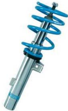
7. ábra. Lengéscsillapító

Számítógépes diagnosztikai padon bevizsgáljuk lengéscsillapítóinak hatásfokát. A műszer kerekenként megmozgatja és leméri a csillapítás idejét és amplitúdóját. Ezeket kiértékelve százalékos arányban tudatja velünk, hogy megfelelők-e vagy sem. Ha a mérés negatív eredménnyel zárul, akkor a lengéscsillapítók cseréire szorulnak!