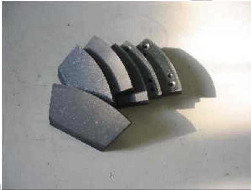
4. ábra. Fékbetétek

A fékbetétnek a fékezés során igen nagy teljesítményt kell kifejteniük, mivel lágyabb anyagból készülnek, mint a féktárcsák. Ennek következtében gyorsabban is kopnak, csereperiódusuk rövidebb. Ha a fékbetétek vastagsága a minimális 2–3 mm alá csökken, akkor az optimális fékhatás már nem biztosított. Ezért rendkívül fontos a megfelelő minőség és a precíz, szakszerű szerelés. Egy szakszerűen szerelt fék a rendeltetésszerű használat során a fékbetét teljes élettartama alatt biztosítja az új fék alkatrészrel megegyező hatást. Kivétel, ha nagy sebességről többször durván lefékezik, ilyenkor a fékbetét megég. Ha elkopott fékbetétet használunk, a féktárcsa megsérülhet, és egy hirtelen fékezés esetén a gépkocsi irányíthatatlanná válhat. A fékbetét karbantartást nem igényel, párban cserélik, általában cserétől cseréig szakszerű szerelés esetén problémamentesen használható. Érdeemes megjegyezni, hogy az adott gépkocsihoz több gyártó is készít fékbetétet, de ezek különböző anyagból készülhetnek, ami eltérő hatékonyságot eredményezhet, ezért minden esetben kérjük ki egy szakértő véleményét.