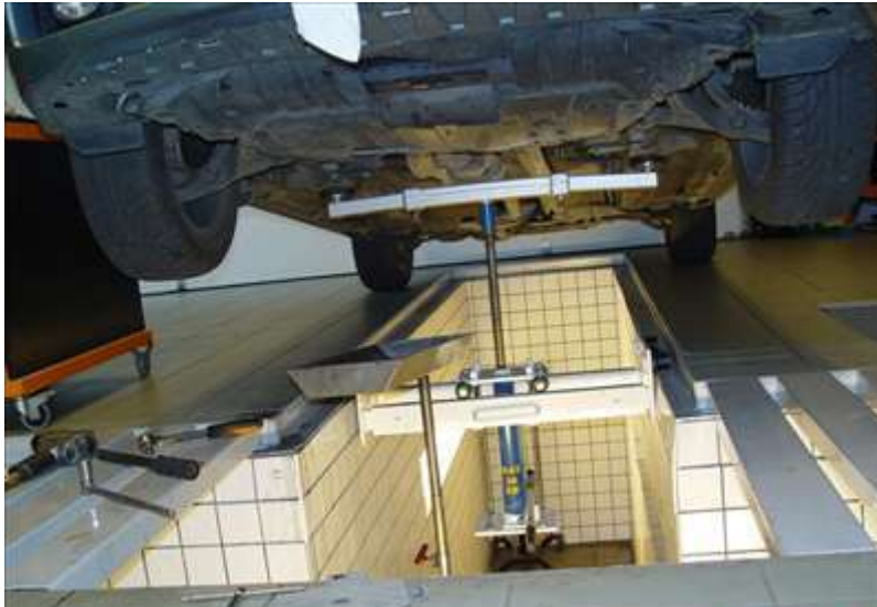
1. ábra. Átvizsgálás