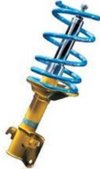
6. ábra. Lengéscsillapító

A lengéscsillapítók vizsgálata általában már mindenhol számítógépes lengéscsillapító vizsgáló padon történik. Ez a mérés közel 100%-os pontossággal megmutatja a lengéscsillapítók jelenlegi állapotát.