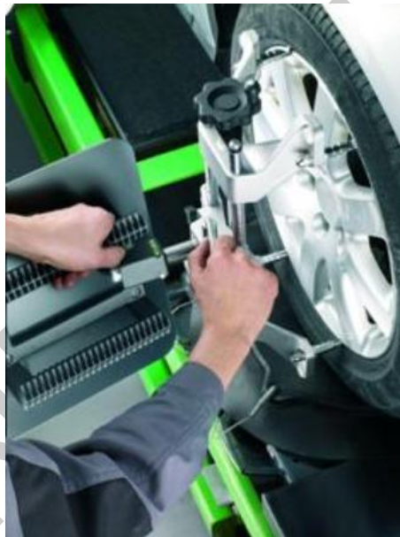
9. ábra. A futómű ellenőrző készülék felhelyezése

Az FWA 4630 készülék tulajdonképpen bárhol bevethető, nincs szükség a műhelyben aknára vagy emelőre. Ez és a nagyfokú méréspontosság a Bosch új technológiájának legfontosabb jellemzői. További egyértelmű előny minden műhely számára a nagyon gyors beüzemelési idő, az egyszerű kezelés és a nagyon kis helyigény, melyek egyaránt a készülék használatát segítik.