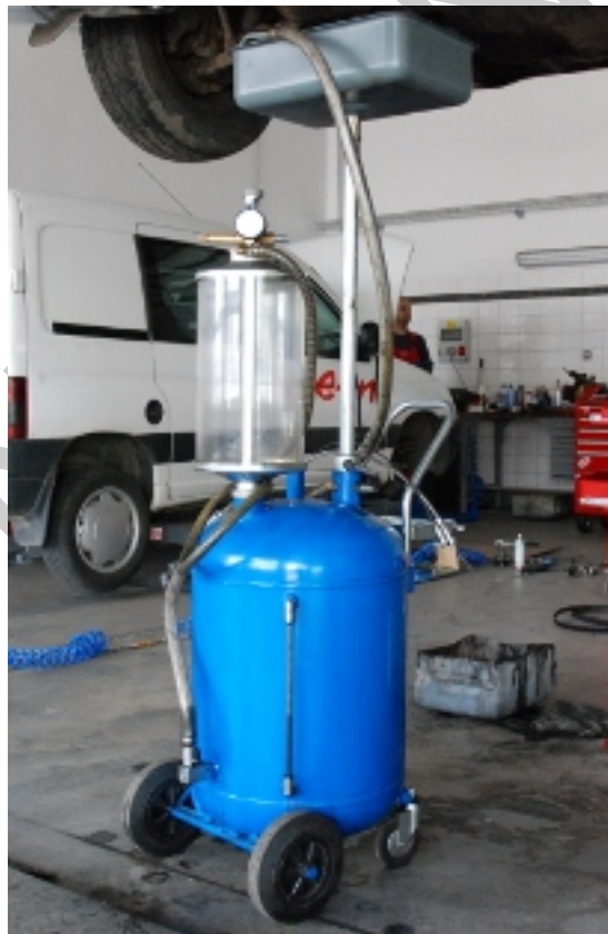
13. ábra. Olajcsere

A kötelező szerviz során a szerelő rendszeresen motorolaj cserét végez. Mindazonáltal, két kötelező szerviz között ellenőrizze rendszeresen gépjárműve motorolaj szintjét. Az olaj szintjének a szintmérő pálca minimum és maximum jelei között kell lennie.