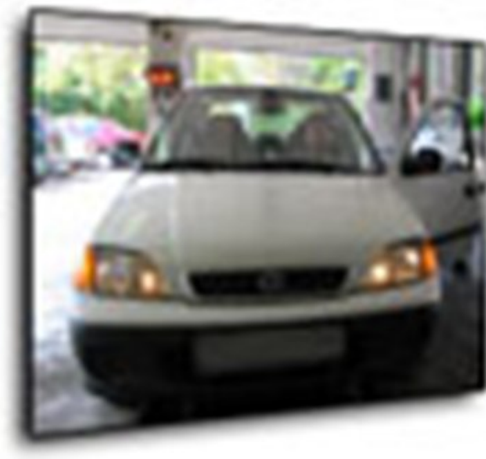
12. ábra. Világítás működésének átvizsgálása

Megvizsgáljuk a fényszórók állapotát (kavicsfelverődés) és határfokát (fény sugar magasságot vizsgálunk és a fény erősségét). Amennyiben a mérések nem kielégítő értékkel szolgálnak állítunk a berendezésen.