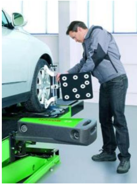
10. ábra. A készülék felhelyezése

A teljes mérési folyamat a nyomtatást is beleértve nem vesz igénybe többet, mint 7 perc. A lehető legrövidebb mérési idő és a különféle mérési programok, továbbá a kinyomtatott mérésprotokollok segítségével a mérést végző műhely teljes eszköztárral rendelkezik az ügyfél szakszerű felvilágosításához.