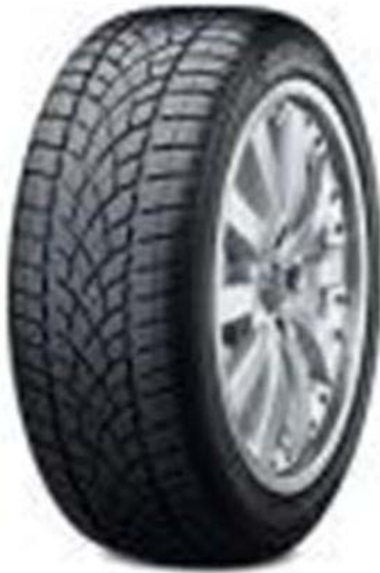
11. ábra. Gumiabroncs ellenőrzés

A gumiabroncsok lehetnek kopottak, szálszakadtak, vagy repedezettek. A felni is sérülhet az idő folyamán! Előfordul, hogy a gumi belső oldalán, ahol a gazda nem is látja sérülés keletkezik! Az ilyen jellegű sérülések nagyon balesetveszélyesek és kedvezőtlenül befolyásolják a gépjármű menettulajdonságait!