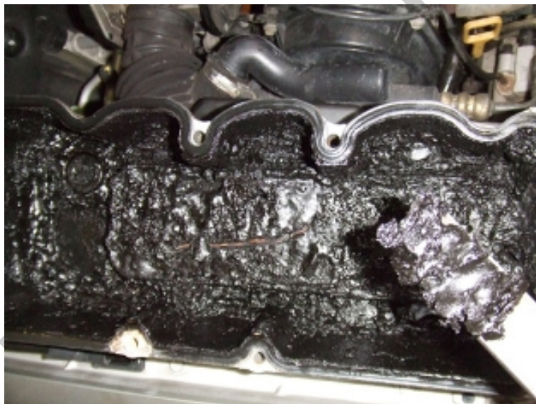
14. ábra. Olajsár az olajteknőben

Megjegyzés: meghosszabbított szerviz intervallumú járművek esetében a figyelmeztető feliratok törlése és ezáltal a számlálók házilagos nullázása esetén a komputer a NEM meghosszabbított intervallum szerint kezd el számolni, tehát ha eddig 30.000 km-es szerviz intervallumú volt az autó, ezután 15.000 km-enként fogja kérni az olajcserét!