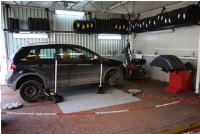
8. ábra. Futómű vizsgálat

Ellenőrizzük a gömbcsuklókat, gömbfejeket és minden forgó-mozgó alkatrészt. A munkafolyamat elvégzése után kiderül, hogy a futóművön milyen alkatrészek szorulnak cserére, illetve javításra. Ezek lehetnek például: szélső-belső gömbfejek, gumiharangok, csuklók, csapágyak és sziletblokkok.