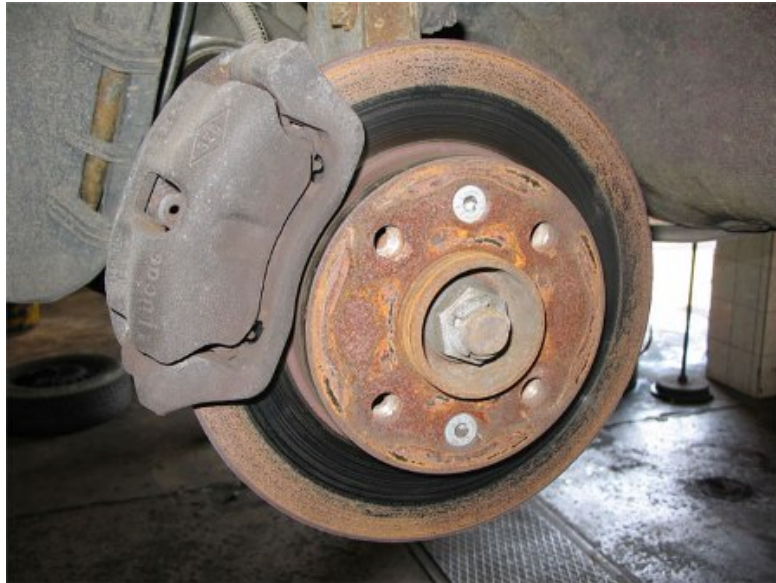
2. ábra. Tárcsafék